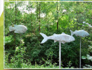
„Fische“ Maria Wiechers Bronze, 2008 von Sponsoren erworben