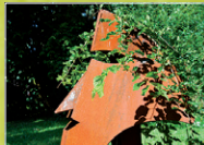
„Innere Trauer“ Stephan K. Müller Industriestahl mit Trauerbaum, 2006