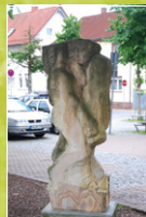
„Mörfelder Kirchhoftanz“ Clemens M. Strugalla Flonsheimer Sandstein, 2005