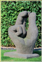
„o.T.“ J. Engelmann Basaltlava Nayen/ Koblenz, 1995