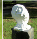
„Schnee-Eule“ Klaus Pfeiffer Marmor auf Basalt, 2007 von Sponsoren erworben