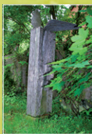
„o.T.“ Wolfgang G. Müller Edelstahl, 1995 Dauerleihgabe