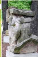
„Versuch über die Enge“ Clemens M. Strugalla Schlesischer Smilov- Sandstein, 2001