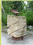
„Bewegtstein“ Regina Planz Martin Steinmetz polnischer Sandstein/ Stahl, 2013